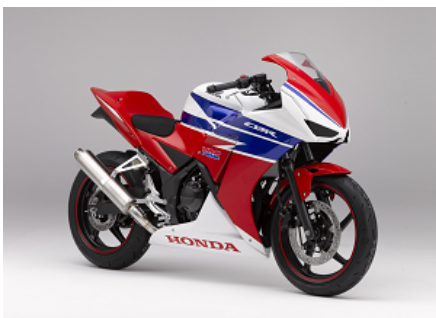
SRS-Moto ベーシック スクール車両 CBR250R ※写真はイメージです

SRS-Motoで使用する車両は、各選手権の登竜門クラスで主流である4ストローク・250ccエンジンを搭載したものを使用します。入門クラスである「SRS-Motoベーシック」ではHonda CBR250Rを、全日本選手権へのスカラシップ選考対象となる「SRS-Motoアドバンス」ではHonda NSF250Rをそれぞれ使い、スカラシップ獲得後、スムーズにレースへ参戦・活躍できることを目指します。