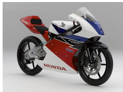
SRS-Moto アドバンス スクール車両 NSF250R ※写真はイメージです