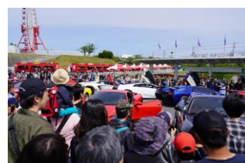
※写真は2019年開催時の様子