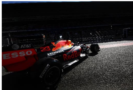
HondaがPUを供給するRed Bull Racing(写真左)と、Scuderia AlphaTauri(写真右)