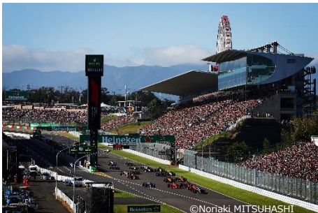
2019年F1日本グランプリスタートシーン