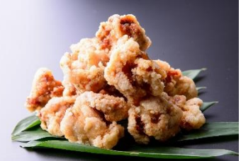
鈴から大盛り 900円 販売店舗:鈴から