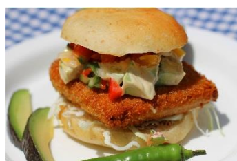
ピリ辛サルサ&アボカドソースのピフカツサンド 1,000円 販売店舗:Cafe&Bar Lapigna