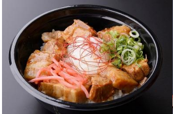
伊勢うまし豚使用とん肉丼 900円 販売店舗:三重豚とん肉丼