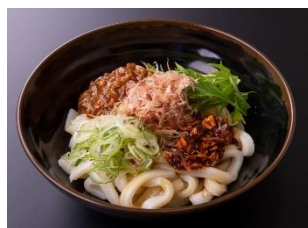
肉味噌まぜうどん 1,000円 販売店舗:伊勢うどん