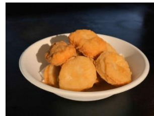
ナゲット 500円 販売店舗:グレイビーバーガー