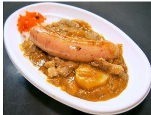
牛すじフランクカレー 1,000円 販売店舗:特製松阪牛すじカレー