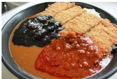
レッド&ブラックジャンボカツカレー 1,200円 (YOSHIMURA SUZUKI MOTUL RACING 応援メニュー) 販売店舗: アドベンチャー 赤と黒のカレーを使用することでチームカラーを連想させるジャンボカツカレー。