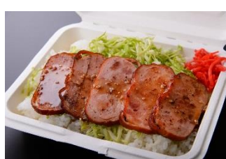
特製プレミアムポーク丼 1,000円 販売店舗:鈴鹿トンテキ本舗