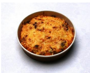
特製チキンドリア 900円 販売店舗:ル・プティ・トノー