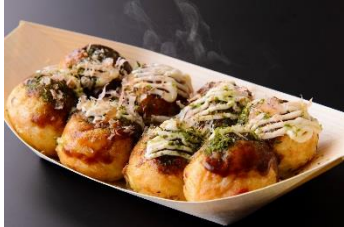
鈴たこ 600円 販売店舗:鈴たこ