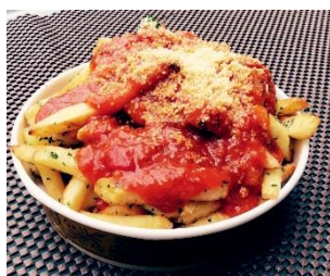
ドミニク特製ボロネーズフライポテト 900円 販売店舗:ドミニクドーセの店