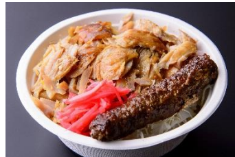
ダブルケバブ丼 1,000円 販売店舗:シシケバブサンド