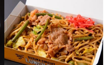
特製スタミナ焼きそば 950円 販売店舗:鈴鹿太麺焼きそば