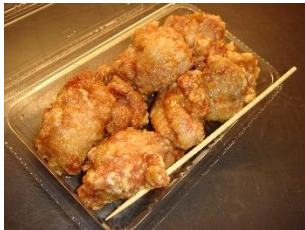
壺漬け唐揚げ 500円 販売店舗:特製松阪牛すじ カレー