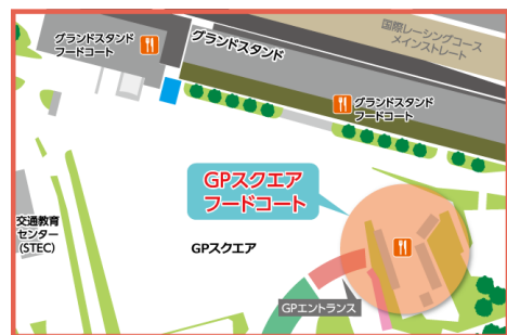
GPスクエア フードコート