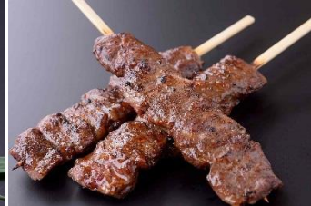
牛カルビ串 600円/1本 販売店舗:カルビ家