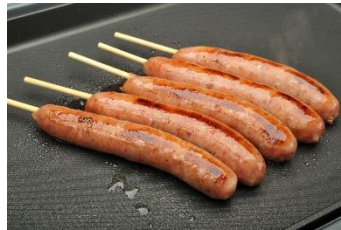
粗挽きソーセージ 300円/1本 販売店舗:松阪牛ロquetteオムライス