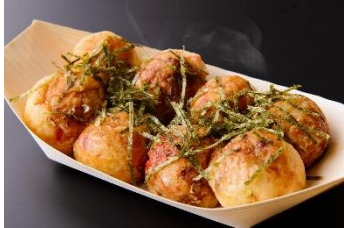
鈴たこ はさめず醤油味 600円 販売店舗:鈴たこ