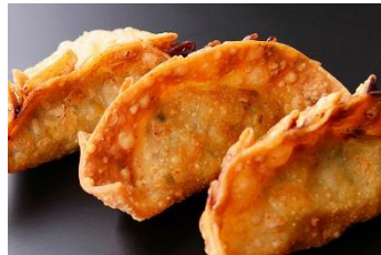
伊勢うまし豚使用 津ぎょうざ 300円/1個 販売店舗:三重豚とん肉丼