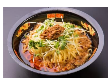
冷やし担担麺 880円 販売店舗:四川担担麺