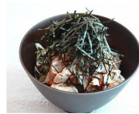
冷製ラー油肉そば 1,200円 販売店舗:GK BURGER CAFE