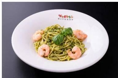
プリプリ海老のバジルパスタ 1,100円 (Red Bull Honda応援メニュー) 販売店舗: プッチタウンキッチン 高橋巧選手の好きなバジルパスタにぷりぷり食感の海老をトッピング。