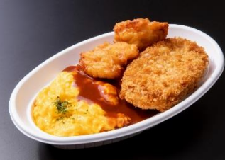
松阪牛コロッケ&チキンオムライス 1,200円 販売店舗:松阪牛コロッケオムライス