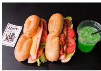
特製8耐ドッグ 800円 販売店舗:Hot Dog Factory