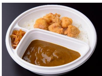
CoCo壱特製フライドチキンカレー 1,000円 販売店舗:CoCo壱番屋