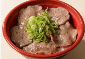
特製塩ダレ牛タン丼 900円 販売店舗:カルビ家