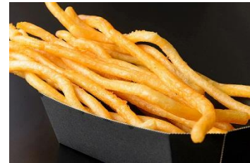
もちりポテト 600円 販売店舗:シシケバブサンド