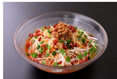
激辛! 冷製担々麺 1,000円 (YAMAHA FACTORY RACING TEAM 応援メニュー) 販売店舗: アドベンチャー 食欲の落ちる夏でも食べやすい冷製担々麺を中須賀選手の好きな激辛メニューとして仕上げました。