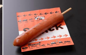
フランクフルト 300円 販売店舗:鈴鹿太麺焼きそば