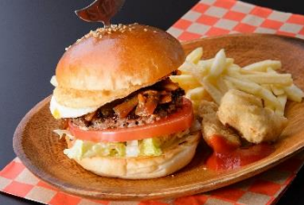
鈴鹿バーガー 1,000円 販売店舗:グレイビーバーガー