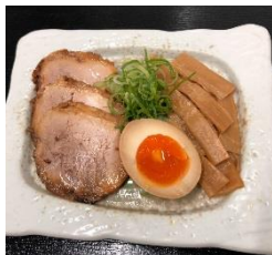
自家製おつまみ チャーシュー&メンマ 500円 販売店舗:辛味噌とんこつらー麺