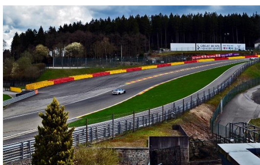
スパ・フランコルシャンの看板設置予定場所

2018年F1日本グランプリの開催に合わせ、V席グランドスタンド裏、逆バンクコーナーの稜線に、スパ・フランコルシャンの看板を設置しました。2019年シーズンに向けて、スパ・フランコルシャンのオー・ルーージュ (Eau Rouge)とラディオン (Raidillon) の間に、鈴鹿サーキットの看板が設置されます。