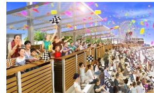
コースビューテラス ※イメージ