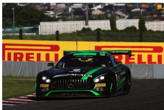
Spa-Suzuka CUPを獲得したSTRAKKA RACING