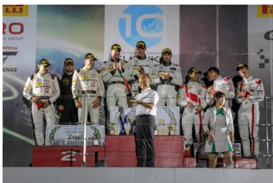
2018 SUZUKA 10H表彰式の様子

スパ24時間レース(2018年7月開催)と、SUZUKA 10H(2018年8月開催)の両方に参戦し、決勝レース周回数の合算が最上位だった、「STRAKKA RACING」に贈呈されました。2019年は、スパ24時間レースで、2018年SUZUKA 10Hと、2019年スパ24時間レースの合算最多周回数、2019年SUZUKA 10Hでは、2019年スパ24時間レース、2019年SUZUKA 10Hの合算最多周回数のチームに、「Spa-Suzuka CUP」の贈呈を行います。