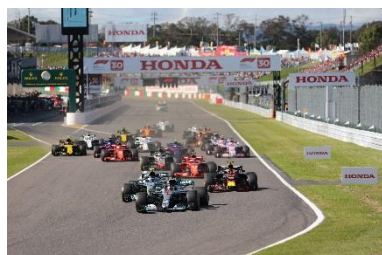
2018年Honda F1日本グランプリ スタートシーン

2018年に引き続き、ご家族みんなでF1を楽しんでいただきたいという思いを含め、3歳から中学生までの子ども料金を、3,000円に設定します。また、10月11日(金)～13日(日)のレース開催日に加え、10日(木)・14日(月・祝)の入場と、合計5日間のモートピアパスポートが付いていて、期間中ご家族でゆうえんち「モートピア」をお楽しみいただけます。