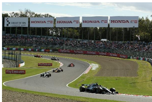
逆バンクコーナーの稜線看板(写真左)