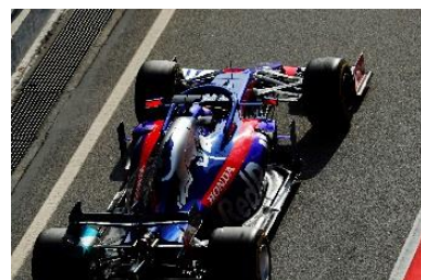
Toro Rosso Honda