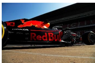
Red Bull Racing