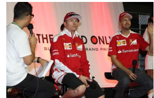
2016年のF1日本グランプリ前夜祭の様子