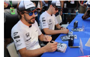
2016年のドライバーズサイン会の様子