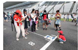
2016年のホームストレートウォークの様子

決勝レースが終わった翌日まで鈴鹿サーキットに滞在されるファンのみなさまのために、10月9日(月・祝)には、「月曜ファンミーティング」を開催いたします。スペシャルゲストを招いてのトークショーや、F1マシンが走行したホームストレートを歩くことができる「ホームストレートウォーク」、決勝の熱戦を映像で振り返るプレイバック放映などでお楽しみいただけます。