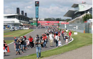
2016年の東コースウォークの様子