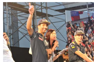
2016年のF1ドライバーズトークショーの様子

他のグランプリでは類をみない現役ドライバーのトークステージが続々と決定。 “世界で一番ドライバーと近いグランプリ”をお楽しみください。