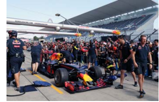
2016年のF1ピットウォークの様子