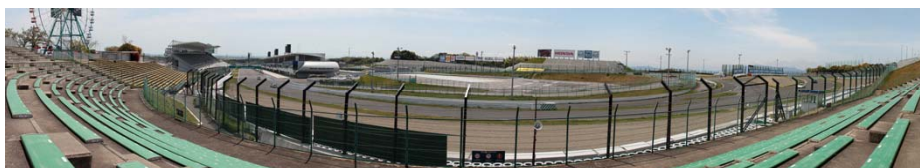
R席からのパノラマビュー