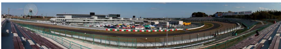
E席からのパノラマビュー