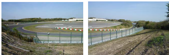
西エリアのスプーンカーブ(Nエリア)からの眺め