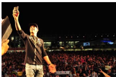
トークショーでのファンとの交流を 楽しむルイス・ハミルトン

特別ピットウォーク、東コースウォーク、全ドライバーが参加するサイン会、F1ドライバーが登場してのトークショーなど、F1ドライバーとファンが近づけるイベントを多数開催いたします。さらには決勝レース翌日にもF1の余韻を楽しめるトークショーやプレイバック上映、コースウォークなど、世界を転戦するF1グランプリの中でも、鈴鹿サーキットでしか味わえないイベントを開催し、世界で唯一の鈴鹿F1日本グランプリを、ファンの皆様とともに盛り上げていきます。また、国内のファンのみならず、海外からご来場いただくファンにもお楽しみいただけるように情報発信してまいります。