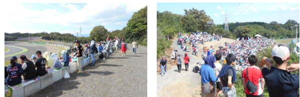
2015年決勝日の西エリアスプーンカーブの様子。 Lエリア(左)とMエリア(右)