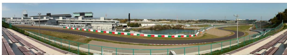
D席からのパノラマビュー

リーズナブルな価格のD席(大人18,600円～)やE席(大人14,400円～)、メインゲートに近くシケインからメインストレートまで見渡せるR席(大人45,300円～)など、イベント会場「GPスクエア」へのアクセスが便利な指定席も好評販売中です。レースもイベントも一日中楽しめる席で、F1日本グランプリをぜひご満喫ください。