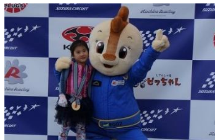
ガールズ賞 ※イメージ