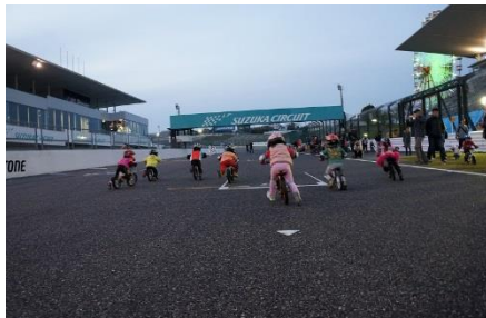
STRIDERマラソン ※イメージ