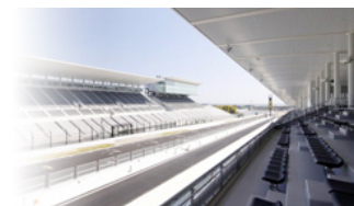
ホスピタリティテラス