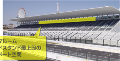
パノラマルーム グランドスタンド最上段の プライベート空間

パノラマルームはグランドスタンド最上段のプライベート空間。冷暖房完備の個室で、周囲を気にせずゆったりとご観戦いただけます。サーキットビジョンを見ながらの観戦やコースを回る観戦のベースキャンプにも、またお子様連れのご家族にもおすすめです。