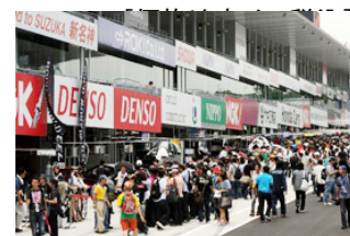
過去のピットウォークの様子

※前売ピットウォーク券は完売する場合があります。お早めにご購入ください 前売ピットウォーク券が完売の場合は、当日ピットウォーク券の販売はございません ※ピットウォーク時に、脚立のお持込はご遠慮ください