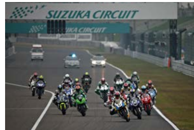
2013年 J-GP2スタートシーン