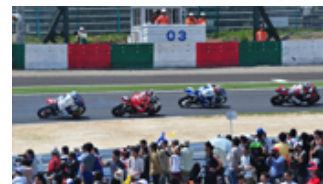
過去の激感エリアの様子