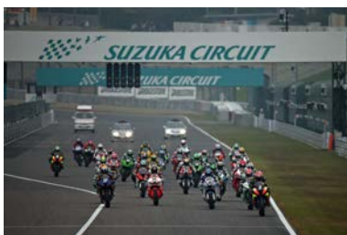
2013年 ST600スタートシーン