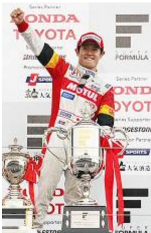
山本 尚貴 (やまもと なおき)

昨年、選手権第3位で迎えたスーパーフォーミュラ第7戦(最終戦)で、レース1、レース2ともに予選ポールポジションを獲得。決勝でもそれぞれ優勝、3位を獲得し、逆転で国内トップフォーミュラのチャンピオンとなりました。SUPER GTにおいてもポッカサッポロ1000kmで初優勝を果たし、国内4輪レースにおいて目覚ましい活躍をしています。