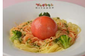
まるごとトマトの冷製パスタ 1,000円

トマトやレモンの酸味のきいた冷製パスタは、疲れた体を癒してくれます。他にも夏限定やファミリー向けのメニューが揃い、お子さまにも大人気のレストランです。