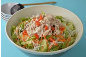
ジャンボ冷しゃぶ中華(4人前) 2,400円

みんなと一緒に楽しめるジャンボ冷麺が登場。プールで遊んだ後は、みんなで一緒にジャンボランチ攻略に挑戦しよう。