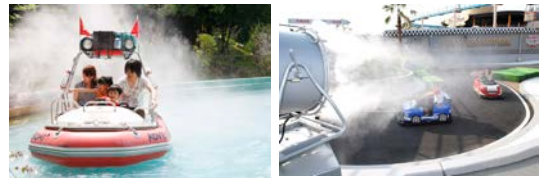
アドベンチャーボート(左)とプッチグランプリ(右)

プールやイベント以外にものりものでも「びしょぬれ」になって楽しめるよう、クールダウンミストを9つのアトラクションに設置。また園内10ヶ所にミストを設置し、ゆうえんちの中でも涼しくお過ごしいただけます。