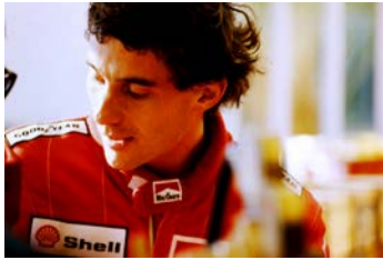
アイルトン・セナ ※1989年日本GPにて

マクラーレン・ホンダで活躍する姿は日本中のファンを魅了し、日本のF1ブームを牽引した。生涯で3度輝いたシリーズチャンピオンはすべて鈴鹿で決め、その3レースともにドラマチックなレースだった。