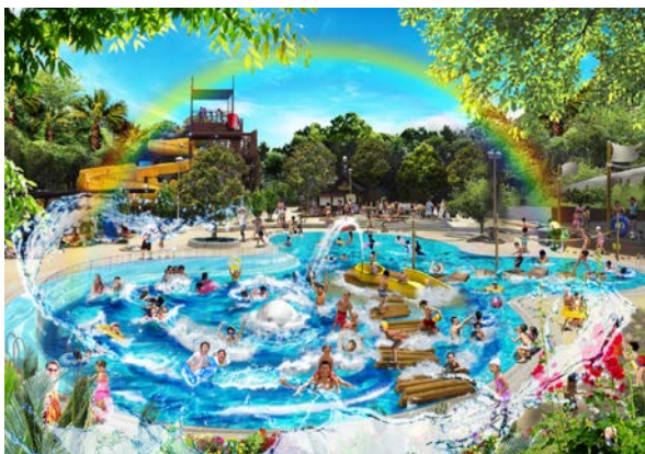
アドベンチャーウェーブ全景 ※イラストはイメージです