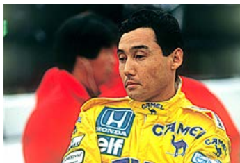
中嶋悟 ※1987年日本GPにて

1987年に日本人初のフルタイムF1ドライバーとしてデビュー。鈴鹿初のF1日本グランプリでは押しも押されぬ主役として登場。その熱い走りは日本のモータースポーツシーンに革新をもたらし、瞬間にF1の魅力が日本中に広まることとなった。