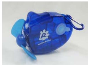
コチラレーシングミストファン 800円