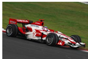
展示車両：スーパーアグリSA07 ※2007年日本GP(富士スピードウェイ)にて