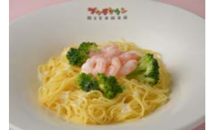
プリプリ海老の冷製レモン風味 パスタ 1,000円