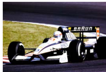
展示車両：ティレル020 ※1991年日本GPにて