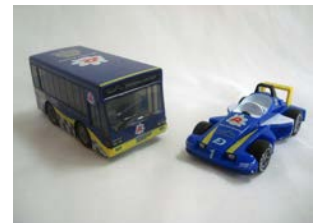
コチラレーシングブルバックカー 各630円