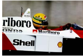
展示車両：マクラーレンMP4/4 ※1989年日本GPにて