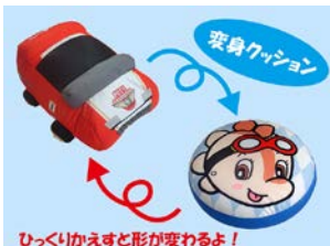
ひっくりかえすと形が変わるよ！ 変身クッション(コチラ) 2,500円

夏の日差し対策に便利なフードの付いたタオルや、ミストとファンのダブル効果でひんやりクールなミストファンは、熱中症対策にばっちりです。小さなお子さまを持つママにもお勧めです。他にもひっくり返すとぬいぐるみからクッションに早変わりするグッズなど、面白いアイテムが登場します。