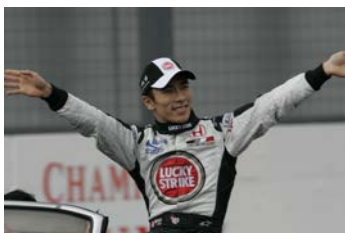
佐藤琢磨 ※2004年日本GPにて

鈴鹿サーキットレーシングスクール(SRS)で育ち、海外で経験を積んでF1ドライバーとして鈴鹿に帰ってきた。チャレンジングなレーススタイルに多くのファンが共感。2006年にはオールジャパンのチーム「スーパーアグリ」から世界に挑んだ。