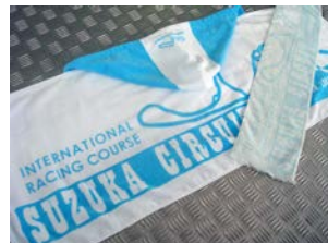
フード付きタオル 2,300円 クールマフラータオル1,000円