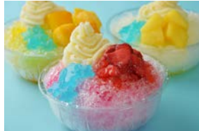
(手前)ハリケーインチゴ (左奥)ゴーゴーマンゴー (右奥)シャイニングパイン 各400円