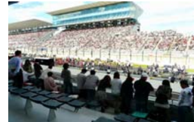
ホスピタリティラウンジ室内 バルコニー席