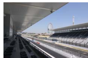
ホスピタリティテラス バルコニー席からの眺め