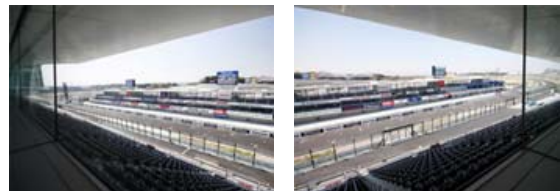
パノラマルームからの景色