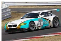
ST-1 BMW Z4 Mクーペ

2000cc以下の車両で争われるST-4クラスは、最多エントリーの激戦区で、インテグラ、S2000、シビックのHonda勢にトヨタ86が挑む展開。1500cc以下の車両によって争われるST-5クラスはHondaフィット、トヨタ・ヴィッツ、そしてマツダ・デミオの三つ巴の戦い。鈴鹿戦は超スプリントだけにこれまでと違った展開になるのは確実。果たしてどのような結末が待ち受けているのだろうか。