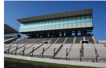
VIPスイート(グランドスタンド上部)

鈴鹿サーキットホテルの料理長が腕をふるった特別なお弁当です。味と色彩をお楽しみください。ビールやワインも楽しめるフリードリンクは2日間ご利用いただけます