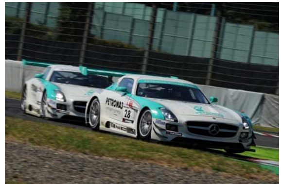
2012年スーパー耐久レースシーン