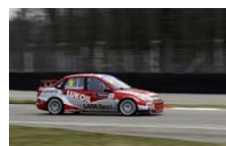
ラーダ・グランタ・スポーツ