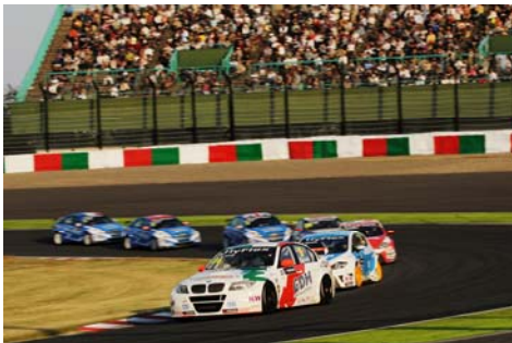
2012年日本ラウンドでのバトル

FIA(国際自動車連盟)が設定した世界選手権はF1、WEC(世界耐久選手権)、WRC(世界ラリー選手権)、そしてWTCCの4シリーズ。WTCCは今年はヨーロッパを中心に各国で開催され、ロシアでも初めて開催されることになった。鈴鹿サーキットは今年で3年目の開催となるが、見どころは超接近戦の激しいバトル。接触寸前、時に接触してしまうこともあるが承知の上。キャリア豊かなトップドライバーたちが揃っており、ハイレベルな攻防が繰り広げられるのだ。