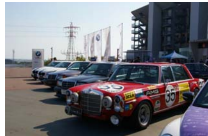
2012年のSUZUKAユーロカーズミーティングの様子