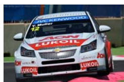
シボレー・クルーズ