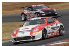
ST-3 ニッサン・フェアレディZ