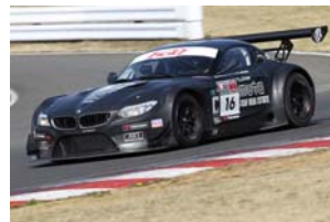
BMW Z4 GT3