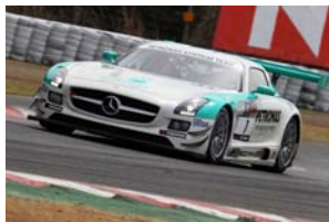
メルセデスベンツSLS AMG GT3

昨年は1時間レースでドライバー交替のためのピットインが行われたが、今年はピットインが行われない予定。速いGT3クラスのマシンがどんなバトルを見せてくれるのか？スーパー耐久初の超スプリント戦は注目の戦いだ。