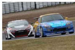
ST-4 Honda S2000(手前)と トヨタ86