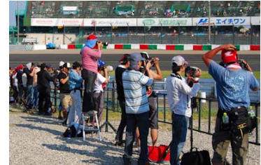
激感エリア(イメージ)