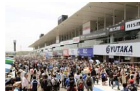
ピットウォーク(イメージ)