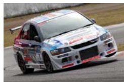
ST-2 三菱ランサーエボリューション