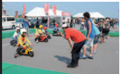
※イベント内容は変更される場合があります。