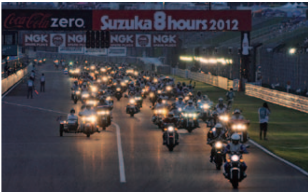
「バイクであいたいパレード」2012年のオープニングの様様

チーム・ライダー、そしてファンが一体となる前夜祭は昨年に引き続 き花火の打ち上げも予定しており、今年も盛り上がること間違いなし!!