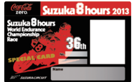
8耐スペシャルカード(顔写真入り) ※デザインは変更する場合がございます。