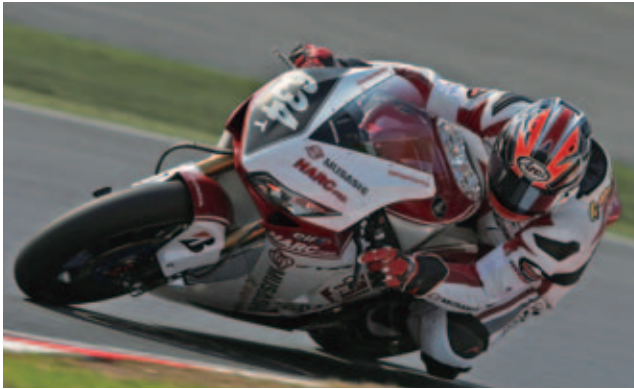
2012年鈴鹿8耐～MuSASHI RT HARC-PRO