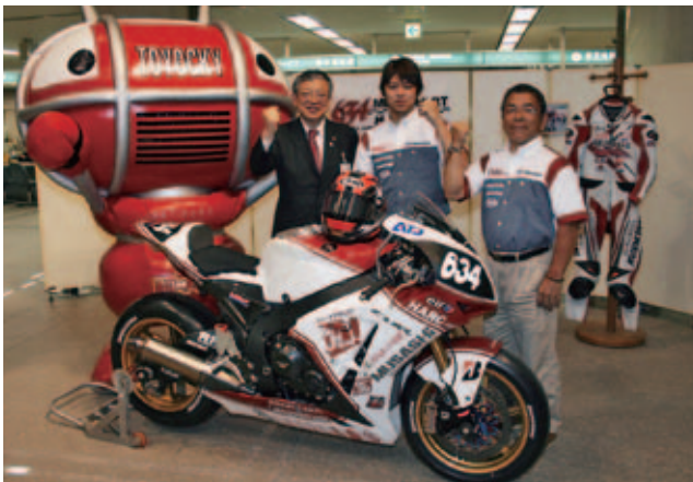
ハルク・プロの豊橋市表敬訪問の様子 (2013年3月1日)