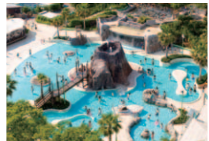
※写真はイメージです。また、イベント内容は変更される場合があります。

2013 FIM Endurance World Championship Series The 36th "Coca-Cola Zero" Suzuka 8hours Endurance Road Race