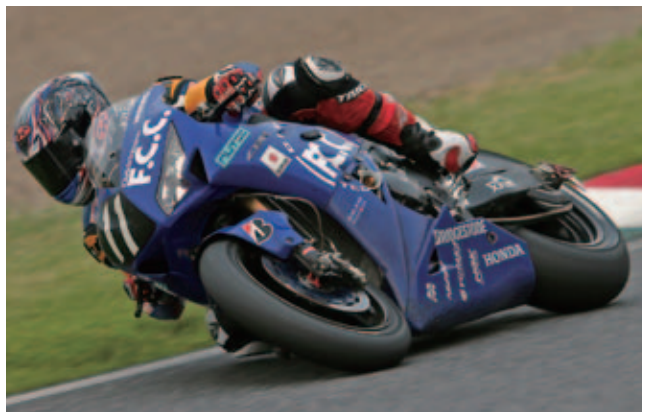
2012年鈴鹿8耐～F.C.C. TSR Honda