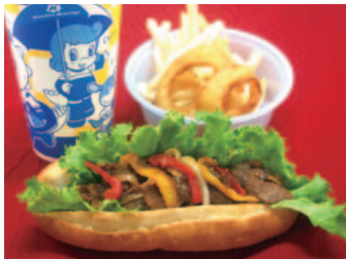
⑤焼肉DOG出口スペシャルセット (出口修選手とのコラボメニュー)