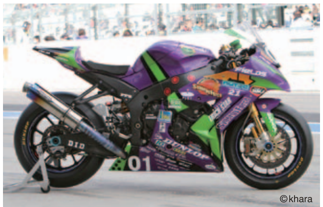
エヴァRT初号機 シナジーフォースTRICK STAR