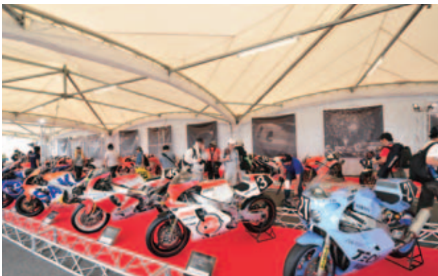
2012年特別展示「情熱の8耐～語り継ぎたいこと」の様子