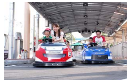
プッチグランプリ