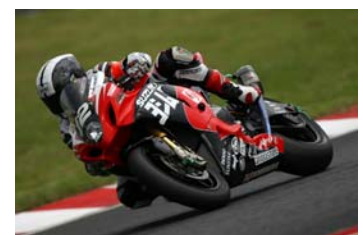
ヨシムラSUZUKI Racing Team ※2011年鈴鹿8耐にて

過去、鈴鹿8耐で4度の優勝を記録している名門チーム「ヨシムラSUZUKI Racing Team」が、昨シーズンST600クラスに参戦した津田拓也を起用し鈴鹿2&4レースに参戦する事が決定した。5度目の優勝を狙う今年の鈴鹿8耐に向けてのチームカアップを狙った参戦だ。