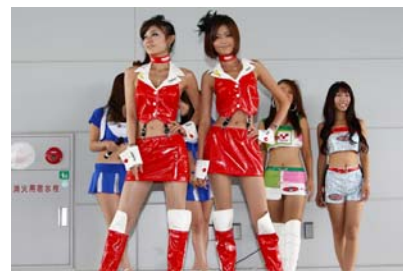
過去のレースクイーンフォトセッションの様子