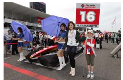
過去のグリッドキッズの様子

※チーム・選手の希望は第2希望まで承りますが、同じチーム・選手に多数のご応募があった場合、ご希望に添えない場合がございますので予めご了承ください。