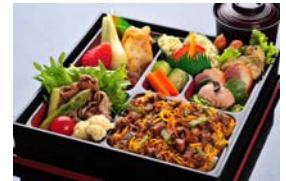
スペシャルランチBOX

「ホスピタリティラウンジ」でしか食べられない特別メニューです。こだわり抜いた三重県産の地元食材を使用し、グレードUPしました。また食後には地元の水谷養蜂園のハチミツを使ったホスピタリティラウンジ限定デザートもお楽しみいただけます。