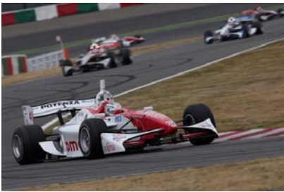
フォーミュラ・ニッポン(イメージ)

はこれまでもチーム移籍初年度に優勝した実績があり、強豪チームへの移籍となるだけに今年も優勝争いに加わってくるはずだ。松田もブランクがあるとはいえ、一昨年はシーズン途中から参戦した実績があり、復帰するのは過去2回タイトルを獲得した古巣のチームインパル。2人ともマイナスになる要素は何もない。開幕戦の鈴鹿から実力発揮、チャンピオン対チャンピオンの激戦が見られるはずだ。