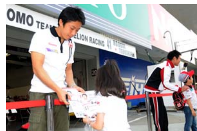
過去のキッズピットウォークの様子