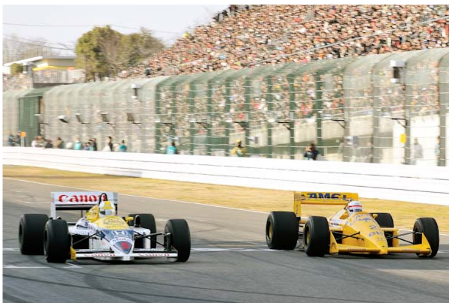
鈴鹿サーキット50周年ファン感謝デーでの二人のバトル。 星野一義(左・ウィリアムズFW11)と中嶋悟(ロータス100T)

鈴鹿サーキット50周年ファン感謝デーで果たせなかった「F1夢の競演」の最終決着が2&4レースで実現！ 「夢のF1競演 中嶋悟×星野一義 最終決着！」