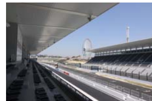
ホスピタリティテラス バルコニー席からの眺め