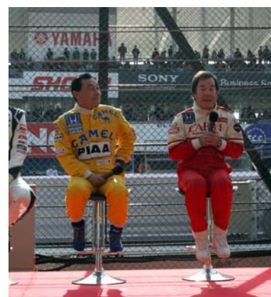
鈴鹿サーキット50周年ファン感謝デーでのトークショーの様子

1980年代の国内レースを圧巻した星野一義と中嶋悟。世界最高峰のF1の舞台で両雄が対決することを誰もが夢見た。しかし現実には、中嶋は1987年日本人初のF1フル参戦を果たし、星野は日本一速い男として国内に君臨したため、再び二人が交わることはなかった。