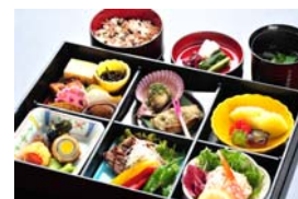
スペシャルランチBOX

三重県産にこだわり抜いた季節の食材で鈴鹿サーキットの料理長が腕をふるった特別お弁当です。ご期待ください！フリードリンクにはワインが、デザートタイムにはアイスクリームサービスが新しく加わりました。