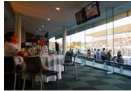
ホスピタリティラウンジ室内

※ファミリーラウンジはご家族でご観戦のお客様皆様の共有ラウンジです。ご家族単位でのお部屋ではございません。なお大人のお客様だけのご利用は出来ません。