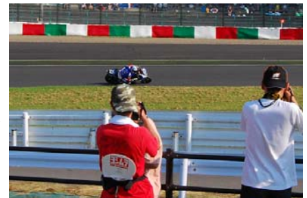
激感エリア(イメージ)