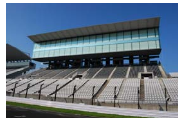
VIPスイート(グランドスタンド上部)

ゆったり観戦できる屋内と、迫力を堪能できる屋根付き屋外スペースが用意されています。