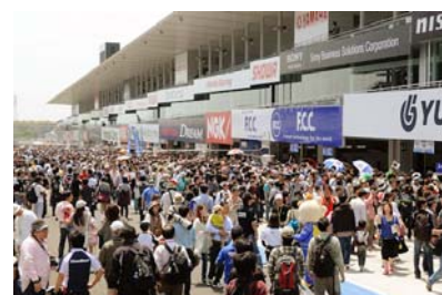
過去のピットウォークの様子