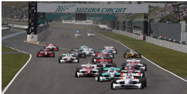
2011年開幕戦スタートシーン

また今大会は、ポッカGTサマースペシャルおよびF1日本グランプリの観戦チケット(いずれも2011年のもの)をお持ちの方を対象に、2,000円でご観戦いただける「特別優待特典」を実施いたします。SUPER GTファンの皆様もF1ファンの皆様も、ぜひこの機会にフォーミュラ・ニッポンの高速バトルをご堪能ください。