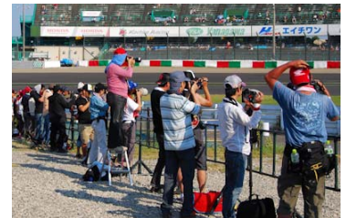
第2コーナー激感エリアの様子

※パドックパスのご購入には観戦券が別途必要です。 ※ホスピタリティラウンジ(ピットビル2階)にはご入場いただけません。 ※前売りパドックパス完売の場合、当日パドックパスは販売いたしません。