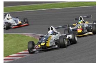
FCJ(※写真はイメージです)

また今回はフォーミュラEnjoyも開催される。気軽に参加できるよう配慮されたレギュレーションを備えたフォーミュラカーレースで、若手からベテランまで多彩なドライバーが参加しているこのレース。普段の鈴鹿クラブマンレースでの開催とは違い、多くのファンが見守るフォーミュラ・ニッポンの会場での開催は、いつも以上に気合が入る、激しい戦いとなるだろう。