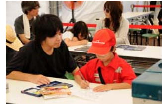
2010年のキッズオアシスのひとこま(ぬりえ)