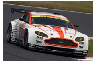
アストンマーティン