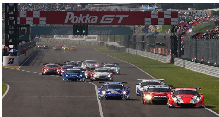
2010年 ポッカGTサマースペシャル スタートシーン

2011年、全8戦で争われるSUPER GTシリーズの中で「ポッカGTサマースペシャル」は第5戦。シーズンの折り返しを迎え、各チームともタイトル獲得に向けた重要な戦いとなることは間違いない。またSUPER GTシーズン唯一の鈴鹿サーキットでの開催となるため、ファンにとっても見逃せない一戦だ。