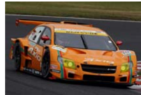
カローラアクシオ