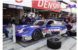
タイヤ戦略が注目される ※写真はイメージです

これで注目されるのが、「タイヤ戦略」だ。今年はブリヂストン、ヨコハマ、ダンロップ、ミシュラン、ハンコックの5メーカーが参戦している。各メーカーとも夏の500kmレースはタイヤに厳しいのは当然。タイヤのライフをいかに持続させるかのタイヤマネジメントが重要となるわけだ。