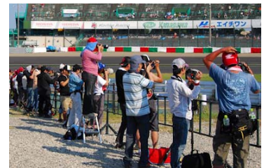
第2コーナー激感エリアの様子