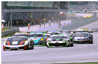
2011年第2戦(マレーシア) スタートシーン

マレーシアを中心に中国、インドネシアなどアジア各国を転戦しながら争われているのが「GTアジアシリーズ」だ。マシンはFIA GT規格の車両で、SUEPR GT、GT300でもおなじみのランボルギーニ・ガヤルド、フェラーリ458、ポルシェ、アストンマーティンが参戦。他にフォードGTなども参戦している。このシリーズは各車と同じコンディションになるよう性能調整が行われ、レース距離も約100kmとスプリントレース形式(1レース40分)。そのため、毎回激しい接近戦のバトルが展開されている。