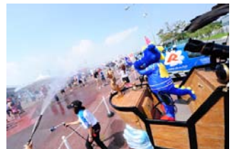
クールダウンエリア

※コチラレーシング登場時間は、決定次第鈴鹿サーキットホームページでお知らせします。