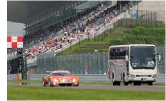
サーキットサファリ