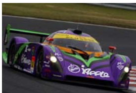
エヴァンゲリオン初号機

中でも注目のは毎シーズンチャンピオン争いをする紫電のエヴァンゲリオン初号機、開幕戦の予選2位のイカ娘(フェラーリF430)、そして2戦目で4位に入った初音ミク(BMW Z4M GT3)だ。成熟されたマシン、紫電を使用しているエヴァンゲリオン初号機はもちろんのこと、今シーズン好調のFIA GT規格マシンを使用しているイカ娘と初音ミクは、いつ勝ってもおかしくない状況。ポッカGTサマースペシャルでは、キャラクター系マシンによる優勝争いが見られるかもしれない。