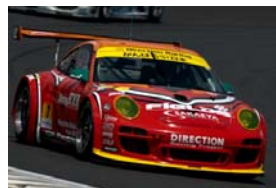
エヴァンゲリオン弐号機