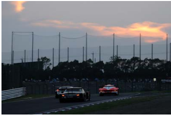
夕暮れの鈴鹿サーキットを走るマシン ※写真はイメージです

今年ポッカGTサマースペシャルは、節電への配慮によりレース距離が昨年までの700kmから500kmに短縮され、伝統のヘッドライトを点灯してのチェッカーフラッグではなく、夕陽に照らされたサーキットでゴールを迎えることになる。だがハイレベルな戦いなのは変わらない。走行距離が短くなった分ハイスピードな戦いになるのは確実。