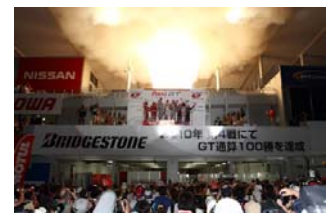
2010年のメインストレート開放のひとつま

決勝レース終了後、グランドスタンド前のゲートをオープンしメインストレートを開放！みんなで感動の表彰式、そして勝者を称え、全てのドライバー、チームの健闘を称える花火を体感しよう！