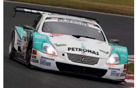
レクサスSC430(PETRONAS TOM'S SC430)

昨年、HSV-010を投入したHonda陣営は引き続き5台が参戦。ニッサンGT-R陣営はGT300クラスからMOLAチームが加わり計4台。レクサス陣営もBANDOHチームが加わり計6台が参戦。3メーカーが昨年以上に力を入れ、必勝態勢で臨むGT500クラスは参戦台数15台となり、例年になく激しいバトルが繰り広げられている。