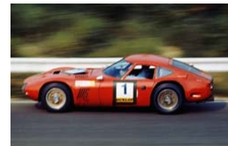
第1回大会で優勝したトヨタ2000GT