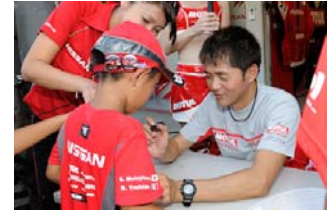
2010年のキッズウォークのひとつま

ピットウォークは混雑していて子供と一緒に心配という家族連れに朗報！ SUPER GTではもうおなじみの、お子さま連れの方のみが参加できる「GT KIDS WALK」が土曜日の予選終了後に行われます。対象は中学生以下のお子さまと保護者の方(2名)で、参加無料。お子様向けのイベントも盛りだくさんの「GT KIDS WALK」に、是非ご参加ください。