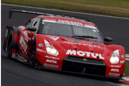
ニッサンGT-R(MOTUL AUTECH GT-R)