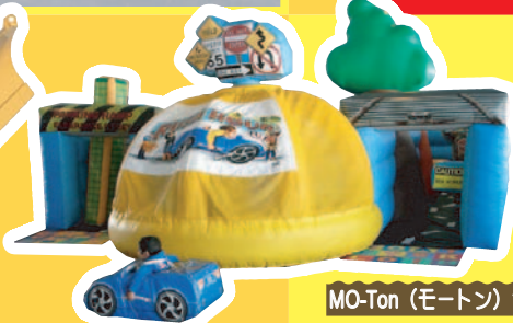
MO-Ton (モートン) ラッシュアワー