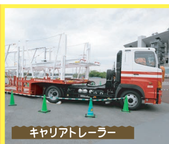
キャリアトレーラー