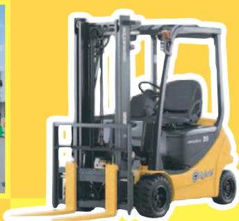
バッテリーフォークリフト