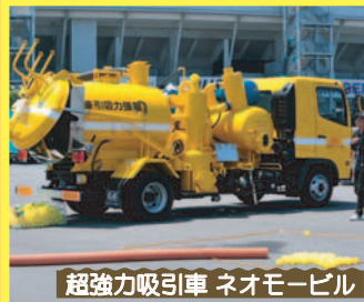
超強力吸引車 ネオモービル