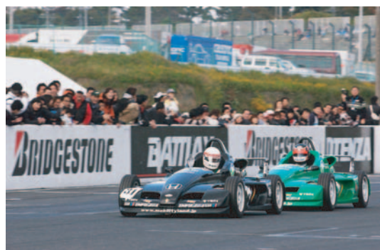
過去に開催されたデモレースの様子

※荒天や都合によりイベントは変更・中止となる場合がございます。予めご了承ください。