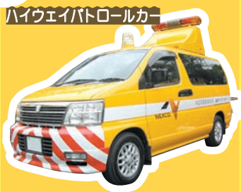
ハイウェイパトロールカー