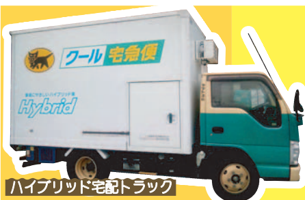
ハイブリッド宅配トラック