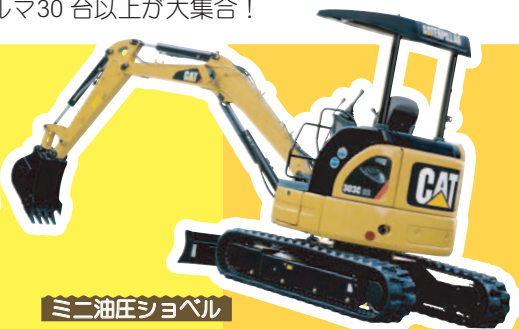
ミニ油圧シヨベル