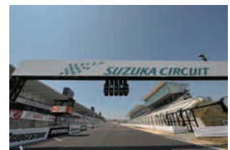
国際レーシングコース