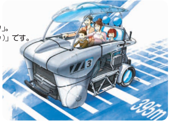
※このイラストは開発中のものです。

さまざまな可能性の“きっかけ”を見つけることができる「モビパーク」。そこに、新発想をぎゅぎゅ詰めて登場するのがこの「ene-1(エネワン)」です。「エネワン」はエコドライブに必要な不可欠なアクセルワークと、家族で協力することでたまるエネルギーを駆使し、走行距離を競う今までにない新しいアトラクションです。チャレンジする走行距離は400m。 ①ヒルクライム(上り坂)、②ダウンヒル(下り坂)、③キャメルバックストレート(アップダウン)、④最終コーナーの4つのステージで構成されるコースを走ります。家族で協力してエネルギーをためて、目指せ完走!! 370m以上走ると「エネワンライセンス 銀」、400mを完走すると「エネワンライセンス 金」が発行されます。