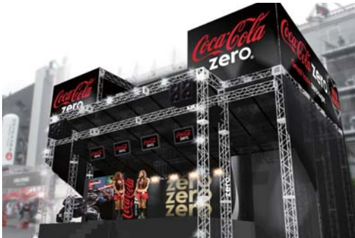
※ブースデザインはイメージです。

8耐でもっとも賑わうGPスクエアの中心となるコカ・コーラ ゼロ イベントステージが、これまでよりさらに大きくなりイベント内容もボリュームアップ。スペシャルゲストのトークショー、SKE48のライブ、キャンペーンガールオンステージなどのステージイベントを開催するほか、コカ・コーラ製品を飲んで参加するゲームコーナーや、コカ・コーラ ゼロ カラーのマシンにまたがって記念撮影できるコーナー、そしてオリジナルグッズショップ「コーク・ストア」も併設される。名物の「コカ・コーラ ゼロ」鈴鹿8耐うちわもここでゲットできるぞ。