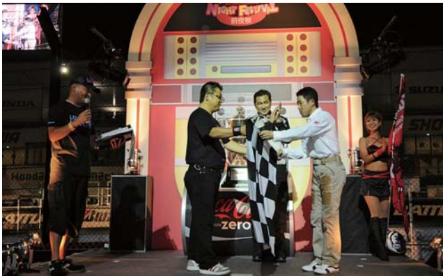
往年のライダーも登場して盛り上げる

また、各チームがサプライズで行うパフォーマンスにも注目だ。チーム、ライダー、ファン全ての人にとって、生まれ変わった鈴鹿サーキットが新しいドラマを生み出す……そんな予感が「コカ・コーラ ゼロ」鈴鹿8耐前夜祭をこれまで以上に盛り上げる。