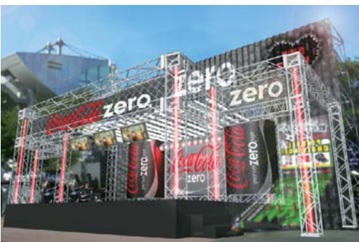
※ブースデザインはイメージです。

8耐でもっとも賑わうグランプリスクエアの中心となるコカ・コーラ ゼロブースがこれまでより一回り大きくなり、イベント規模が拡大されます。ステージではスペシャルゲストのトークショーやゲーム大会をはじめ、これまで以上に様々なイベントが実施され、グランプリスクエアの一大拠点となります。