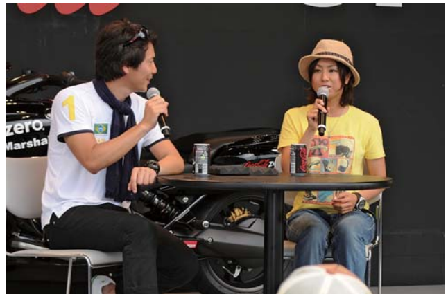
2009年MOTONAVIコラボイベントトークショー