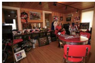
※サポート内容の詳細については、決定次第ご案内いたします。

昨年61店舗で展開したバイカーズカフェ・ネットワークが今年さらに拡大。それに加えて、各店舗でのチケット優待販売や訪れたバイカー達が楽しめる企画を実施。8耐まで待ちきれない楽しい時間を、それぞれのカフェでお楽しみいただけます。