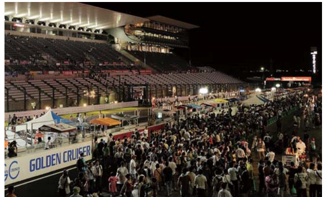
ナイトピットウォーク