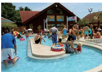
キッズ流水プール