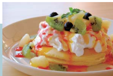
季節のフルーツたっぷりパンケーキ (ヨーグルト風味)...780円