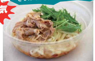
三重豚の冷しゃぶうどん...650円