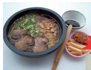
ビッグボセット...2,300円