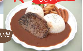
山分けデカバーグカレー...2,300円