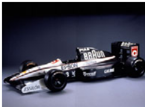
ティレルホンダ020(1991年)