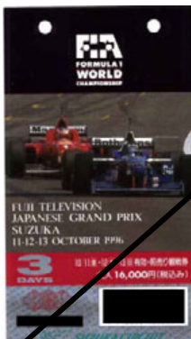
チケットの写真はイメージです