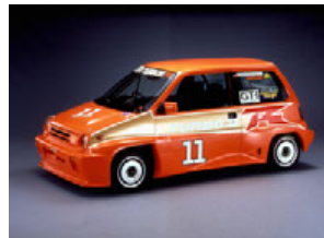
ホンダシティターボⅡR (レース仕様車)(1983年)