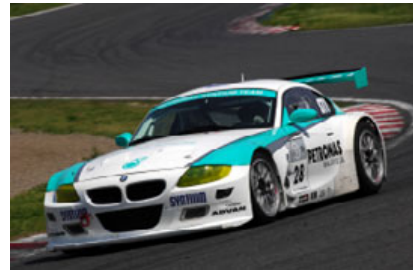
PETRONAS SYNTIUM TEAMのBMW Z4Mクーペ(2008年の走行シーン)

対して、フェアレディZは武器とする絶対的な信頼性で巻き返しを図るはず。それぞれにドライバーラインアップの変化があることも、激戦を予感させる要素だ。まずZ4Mクーペを走らせるPETRONAS SYNTIUM TEAMは、チーム