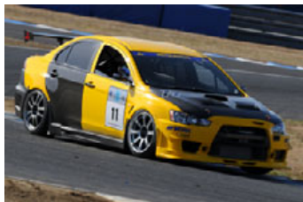
ST-2クラス ランサーエボリューションX

2001~3500ccの四輪駆動車によって争われるST-2クラスは、ランサーエボリューションXの大躍進が期待できそうだ。昨年、鳴り物入りでデビューしたものの、ニューマシンならではのトラブルに見舞われることも多かった。逆に安定感が光りチャンピオンとなったのは同じランサーでも旧型のエボリューションIX。高い熟成度もさることながら、100kg近くエボXより軽いことが、絶対的なマージンとなったのである。