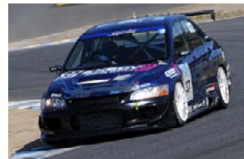
ST-2クラス ランサーエボリューションIX

しかし、今年はエボXに対して、フロント以外のウィンドウの材質、運転席以外のドアの材質を、それぞれ変更することが認められた結果、約40kgの軽量化に成功。またエボXには電子制御デバイスという、絶対的な武器がもとより存在している。タイヤに優しく、それでいて旋回速度も高めているのだ。新旧ランエボが互角の戦いをくり広げるのは必然だ。