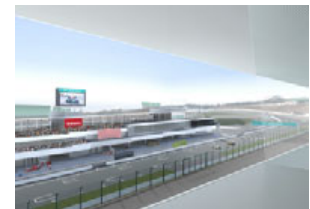
パノラマルームからの眺め ※イラストはイメージです

シーズンシート(パノラマ、V席)をお申し込みいただいたお客様は 10月2日~4日開催のF1日本グランプリレースのチケットを優先的にご購入いただけます。