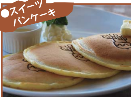
ぶんぶんの国産キラキラ はちみつパンケーキ