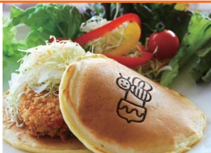
松阪牛コロッケサンドの ガッツリパンケーキセット