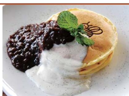
つぶつぶあんこのまったりパンケーキ