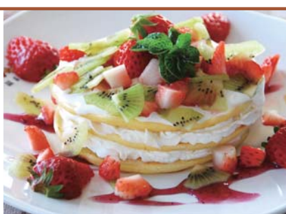
季節のフルーツたっぷりパンケーキ