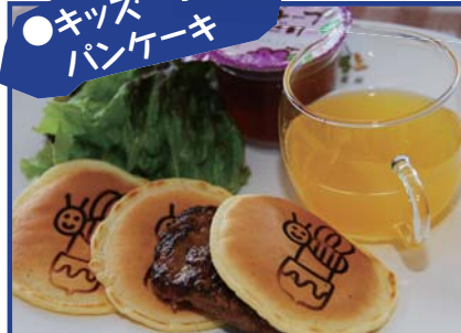
ぶんぶんも大好きな キッズパンケーキプレート