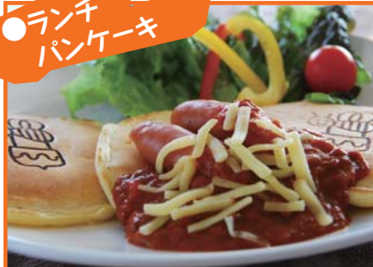
パリッとジューシーソーセージの ミートソース風パンケーキセット