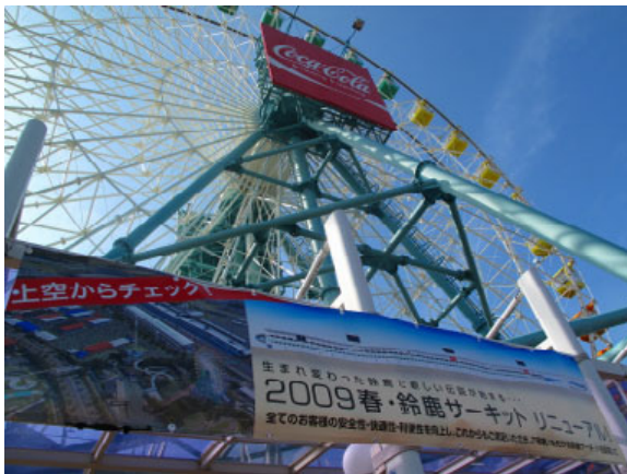
大観覧車ジュピター