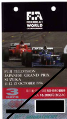
チケットの写真はイメージです