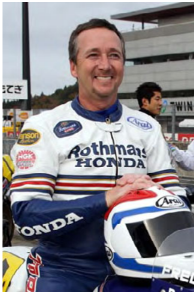
フレディ・スペンサー ※2006年Honda Racing Thanks Day (ツインリンクもてぎ)にて