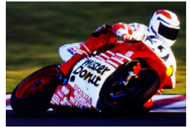
1992年8耐でのフレディ・スペンサーの走り

従来の常識を覆す走り、日本にも熱狂的なファンを多数生んだスペンサーが、再び鈴鹿サーキットに帰ってくる!! デモンストレーション走行やトークショーなど、さまざまなイベントへの参加が予定されており、ぜひ、今年の“コカ・コーラ ゼロ”鈴鹿8耐でその勇姿を見届けてほしい!!