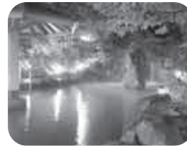
露天風呂もある「天然温泉クア・ガーデン」には2日間入り放題！