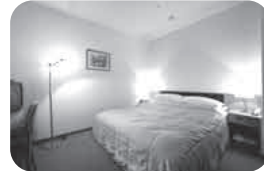
このプランでは、レイトチェックアウトでゆったりして頂けます。写真は本館メヌエットのスイートルーム。

一年に一度の特別な“バレンタイン”。ラブラブなカップルはもちろん、普段は忙しくすれ違っていて…、そんなカップルにもこの日だけはゆっくりお過ごしいただけるよう、お部屋でのサービスを充実した限定プランをご用意しました。二人で取り分ける、ロマンティックなバレンタインディナーもついた贅沢なプランをぜひご利用ください。