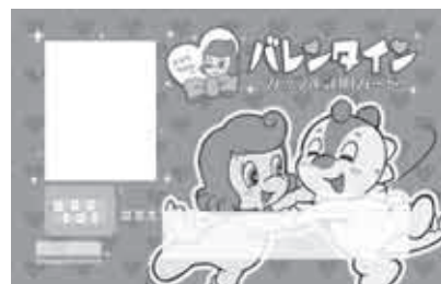
※カードのデザインはイメージです。

■ 期 間：2月9日(土)～17日(日) ■ 場 所：ピピラの本フィールド内ライセンスセンター ■ 時 間：開園時間中常時 料 金：600円/2枚