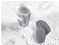
▲ベルギーチョコを使ったマドレーヌ2個のドリンクバーセット(期間限定500円)も登場!