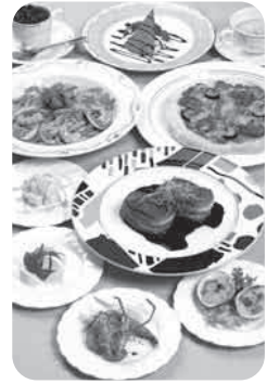
ディナーはロマンティックなイタリアンフルコース。朝食は充実の和洋バイキング。