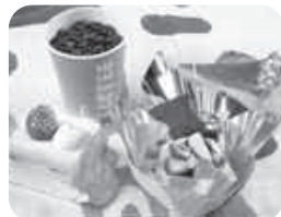
▲パティシエが腕を振るう、バレンタイン特製のスイーツを、お二人でどうぞ。

美味しさでご定評を頂く「ブーランジュリー」から、バレンタインバージョンケーキが登場します。さらに、ドリンクバー付きのケーキセットが期間限定で500円に!