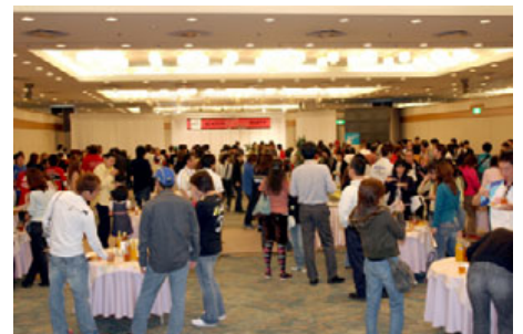
昨年のシーズンエンドパーティーの様子

※先着150名様までの受付となります。 ※3歳未満の方は有料保護者の方の同伴が必要になります。 鈴鹿サーキットホームページよりお申し込みください。