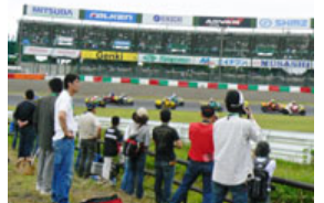
第2コーナーイン側の激感エリアの様子

レースの迫力をより間近に感じていただけ、ゆったりとより快適にご観戦いただけるのが、ピット上のホスピタリティーブース。ピットの様子をまさに真下にご覧いただけます。大屋根の下でゆったりとモニター観戦できるのもホスピタリティーブースの魅力です。