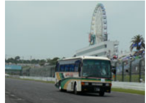
パドックバスをお持ちのお客様は無料でバスツアーに参加いただけます ※写真はイメージです