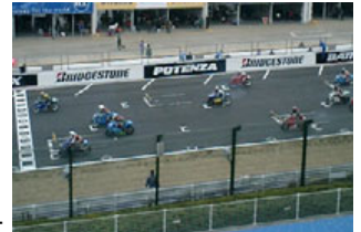
V席から見たグリッドの様子

V席を購入した方限定で表彰式(ポディウム)下の専用エリアまで入場することができる特別な特典をご用意しました。入賞したライダーとチームクルーと一緒にレースの感動を堪能しよう！