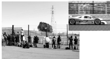
激感エリア(第1コーナー手前イン側) (写真はSUPER GTの様子)

より近くでレースを体感したいと望むファンに向けて、パドック内に『激感エリア』が設定される。第1コーナー手前イン側と第2コーナーイン側の2ヶ所。写真を撮るにもベストポジションだ。しかしそれよりも、空気が震えるのが伝わるほどの至近距離での観戦は、一度体験したら、その迫力に魅せられることは間違いない!!