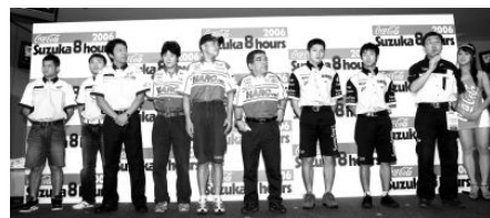
昨年の8耐参戦発表会の様子

“コカ・コーラ ゼロ”鈴鹿8耐の前哨戦としての性格が大きいこの“Road to 8hours”鈴鹿300km耐久ロードレースで、“コカ・コーラ ゼロ”鈴鹿8耐の参戦発表会が10日(日)10:15よりメディアセンター内特設会場で行われる。この参戦発表会はパドックパスさえ持っていれば誰でも見ることができる。普段見ることのできないライダーの素顔が見られると共に、“コカ・コーラ ゼロ”鈴鹿8耐に向けたチームやライダーの意気込みが、いち早く「生の声」で聞けるわけだ。