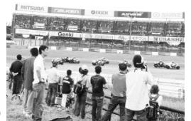
激感エリア(第2コーナーイン側)

※激感エリアへのご入場にはパドックパスが必要です。 ※第1コーナー手前イン側は各レース決勝スタートから3周まで、安全確保のためご入場いただけません。