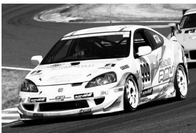
2006年ST-4クラスチャンピオン インテグラ

エンジン排気量2000cc以下の車両で争われるST-4クラスはインテグラ同士の激しい戦いが続いており、ドライバーを含めたチームの総合力が勝敗を左右することになりそうだ。