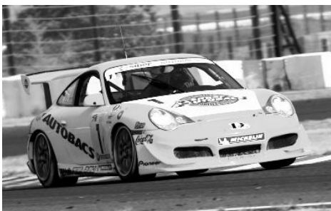
2006年ST-1クラスチャンピオン ポルシェ911GT3