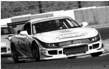
2006年ST-3クラスチャンピオン RX-7