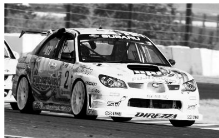
2006年ST-2クラスランキング2位 インプレッサ