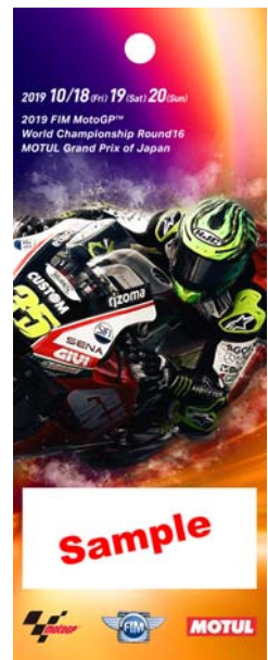
5: LCR Honda