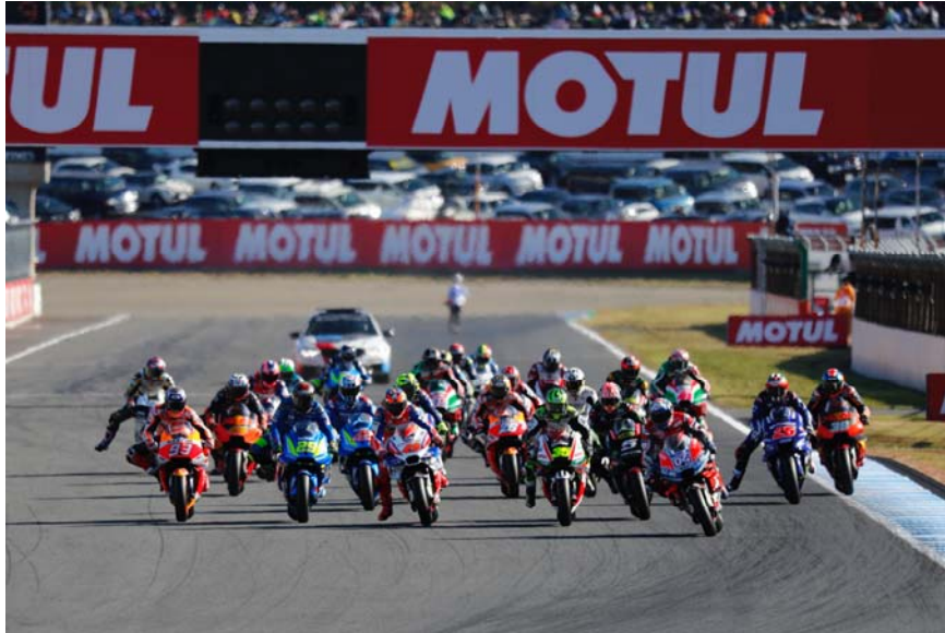
2018年 MotoGP™日本グランプリ スタートシーン

今シーズン、すでに5戦を終え、Honda、YAMAHA、SUZUKI、DUCATIの4メーカーが激しいトップ争いを繰り広げている世界最高峰のバイクレース、MotoGP™世界選手権。そのシリーズ第16戦となる日本グランプリのチケットを6月1日(土)10:00より、ツインリンクもてぎの公式ホームページ( https://www.twinring.jp/motogp/ )をはじめ、コンビニエンスストア、プレイガイドにて発売します。