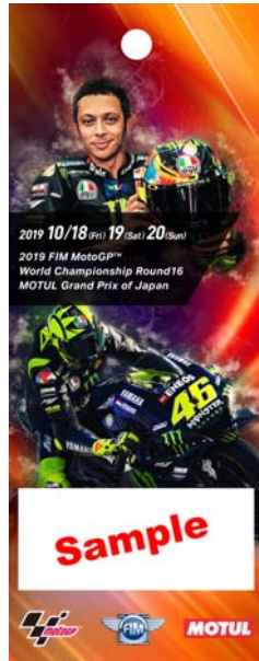
12: ロッシ オフィシャルファン クラブ グッズ付き シート