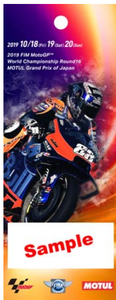
7: Red Bull KTM Tech 3