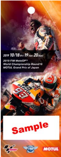
11: マルク・マルケス 応援席