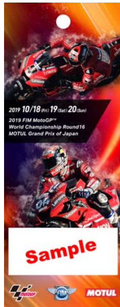
17: ドゥカティ応援席