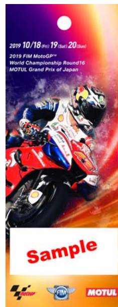
9: Pramac Racing