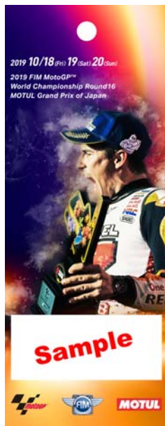
2: マルケス シリーズチャンピオン