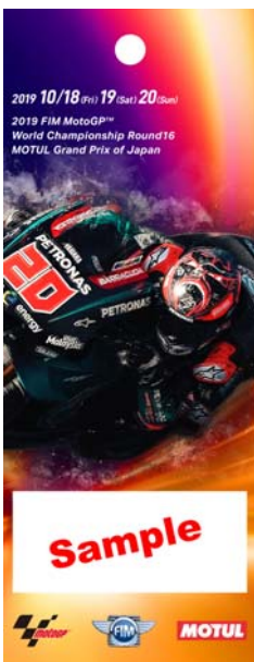
6: Petronas Yamaha SRT