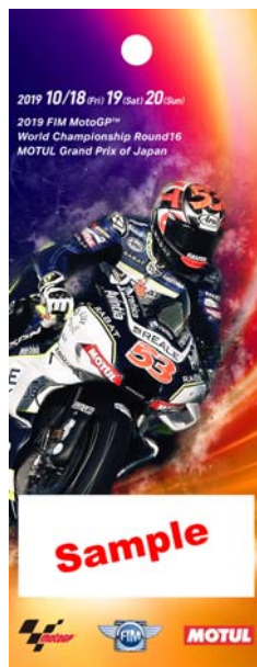
8: Reale Avintia Racing