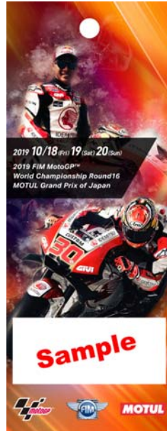
13: 中上貴晶選手 応援席