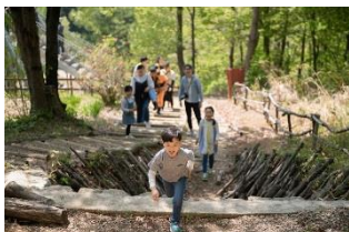
ハローウッズの森には家族で気軽に歩ける散策ルートがいっぱい

「森のふしぎ みつけ！」は、“ハローウッズの森”を散策しながら、森にすむ“生きもの”のふしぎを解いていくクイズ型アトラクションです。例えば、森の中に落ちている通称「森のエビフライ」は一体なんなのか！？など家族みんなで体と頭を使って、30分の最短ルートから2時間以上楽しめる森全域ルートまで好きなルートを散策することができます。