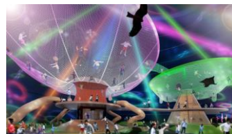
イメージビジュアル