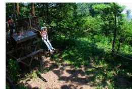
森のジップライン ムササビ