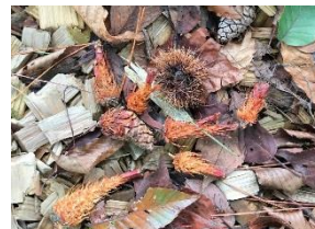
所々に落ちている「ふしぎ」の一つ、通称「森のエビフライ」