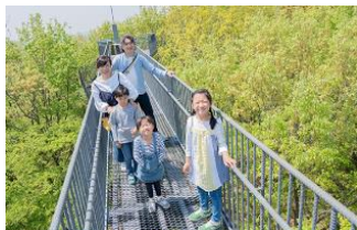
木のてっぺんを観察できる高さ18mの樹冠タワー