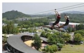
メガジップラインつばさ

「森のジップライン ムササビ」は、小学4年生（身長135cm以上）から体験できます。森のガイドと一緒に自然に触れながら空中散策を楽しむことができます。