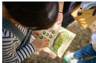
散策しながら森の生きものの「ふしぎ」を見つけよう