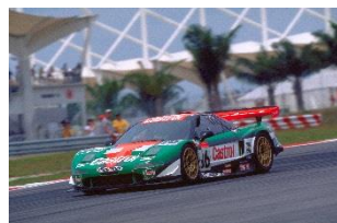
ホンダNSX(2000年) <全日本GT選手権参戦車両>

※イベントは雨天等により中止となる場合があります。また車両は予告なく変更となる場合があります。