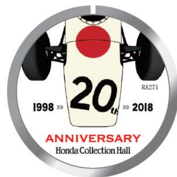
ホンダコレクションホール20周年記念ロゴ

創業期の事業足跡を3つのテーマ「夢のはじまり、夢の実践、夢の拡大」で構成、夢の萌芽から時代を経て変化する夢の実現に向けた創業者の発想と歩みを当時の時代背景とともに紹介します。展示にあたり説明パネル・製品・マシンに加え、新たな試みとして「創業者の肉声放映」や当時のレーシングマシンの設計図面、社内報、カタログを掲載するなど、これまでに無いユニークな構成としています。