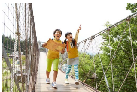
ハローウッズ 冒険のつりばし