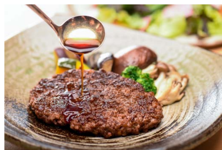
とちぎ和牛ハンバーグ