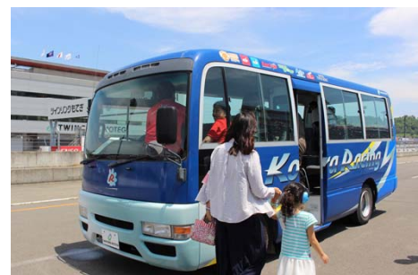
レーシングコースのバスツアー