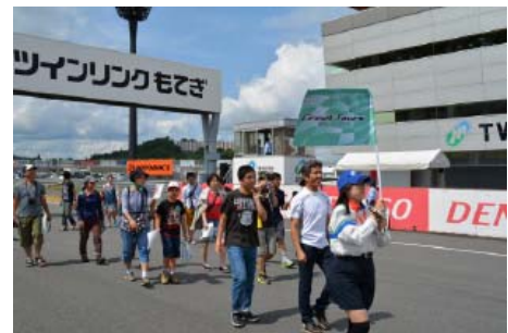
レーシングコースの散策