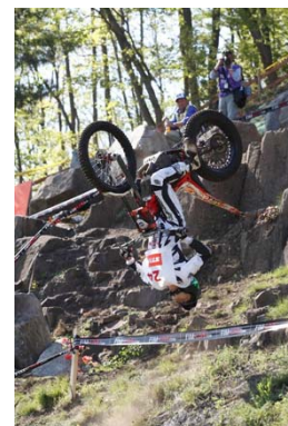
世界一と称されるバックフリップ