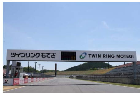
サーキット・クルーズで走行する 国際レーシングコース メインストレート