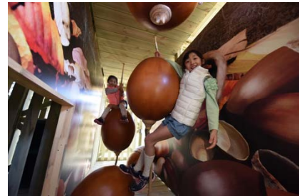
立体迷路「迷宮森殿 ITADAKI」

森の中のモビリティテーマパーク ツインリンクもてぎ(栃木県茂木町)は、2017年4月29日(土・祝)～5月7日(日)のゴールデンウィーク期間中に広大な森で思いっきり遊べるイベント『森のいただきフェスタ』を開催いたします。