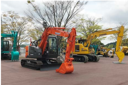
働くクルマ大集合