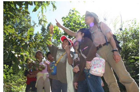
どんぐりの森 冒険指令書(イメージ)