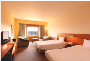
ホテルツインリンク

ゆったりとお過ごしいただける広々とした客室からは、ツインリンクもてぎの自然やレーシングコースを一望でき、夜には満天の星を眺められます。ホテル内には「のぞみの湯」や、栃木県、茂木町の美味しい食材を使った料理をお楽しみいただける「森のレストランMARCHERANT(マルシェラン)」があり、リゾートならではの贅沢なひとときをお過ごしいただけます。