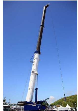
220tオールテレーンクレーン