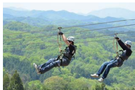
メガジップライン つばさ