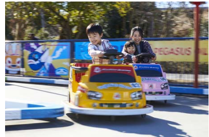
ドリフトキッズレーサー