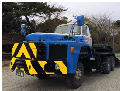
ボンネットトレーラー (70t積載低床トレーラー)