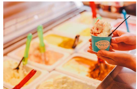
森のジェラテリア ROCCO