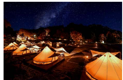
森と星空のキャンプヴィレッジ