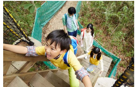
ウリンボ迷路(イメージ)