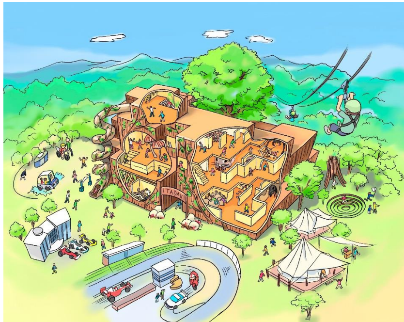
新施設『迷宮森殿 ITADAKI』イメージ

ツインリンクもてぎには国際レーシングコースの周囲に広大な森が広がっており、2000年にその一部を整備して遊べて学べる森「ハローウッズ」としてオープンいたしました。新アトラクション「迷宮森殿 ITADAKI」を体験することによって、「ハローウッズ」をより広い視点でお楽しみいただけるようになるとともに、自然環境への関心も高まっていくことでしょう。