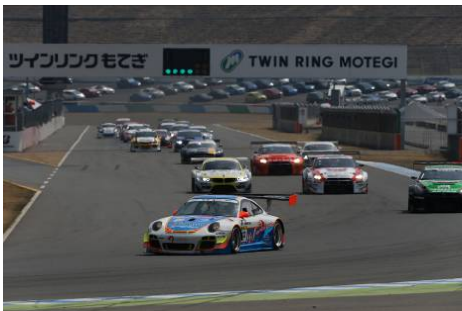
2015年スタートシーン

前売チケットは、2月13日(土)から販売いたします。なお、前売チケットをお持ちの方は、3月6日(日)に予定しているスーパー耐久公式テストの入場が無料となります。