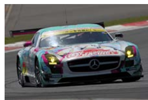
昨年のチャンピオン グッドスマイル 初音ミク SLS