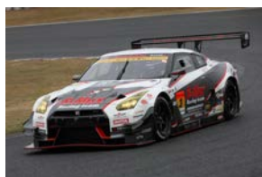
1ポイント差で追う B-MAX NDDP GT-R