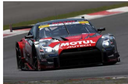
ランキング3位の MOTUL AUTECH GT-R