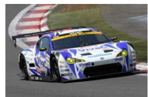
VivaC 86 MC (TOYOTA 86 マザーシャシー)