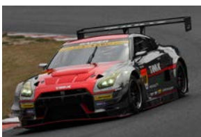
ランキングトップの GAINER TANAX GT-R