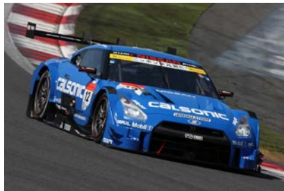
ランキング2位の カルソニック IMPUL GT-R