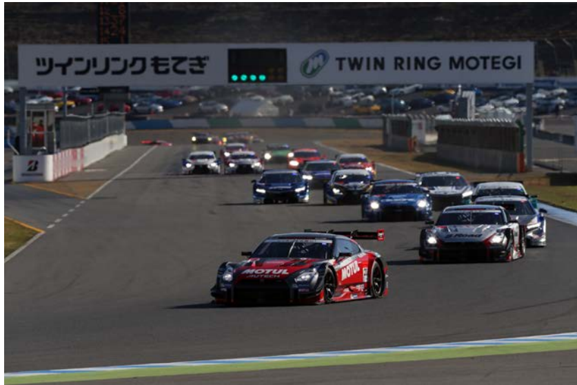
2014年のスタートシーン