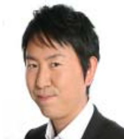
《チュートリアル 福田充徳》