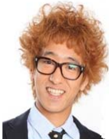
《カナリア ボン溝黒》