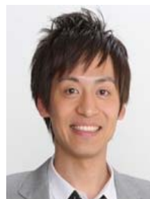
《とろサーモン 村田秀亮》