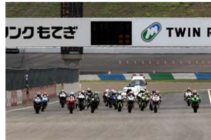
2013 MOTEGI 2&4レース J-GP2スタートシーン