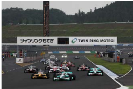
2013年MOTEGI 2&4レース スーパーフォーミュラ スタートシーン