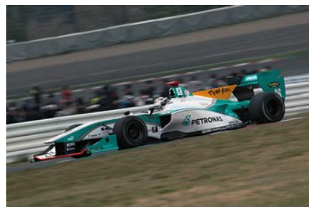
第2戦レース2で優勝したロッターラ