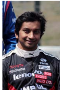
N・カーティケヤン

今年の参戦ドライバーは、Hondaエンジン勢ではヴィタントニオ・リウツィ(HP REAL RACING)、トヨタエンジン勢では中嶋一貴、ナレイン・カーティケヤン(Lenovo TEAM IMPUL)の3人の元F1ドライバーに続き、2012年のWEC(世界耐久選手権)チャンピオン、アンドレ・ロツテラー、2013年のWECチャンピオン、ロイック・デュバルが参戦。中嶋、ロツテラー、デュバルはスーパーフォーミュラのチャンピオン経験者だ。F1テストドライバーを務めたキャリアがあり、開幕戦では2位表彰台を獲得したジェームス・ロシター(KONDO