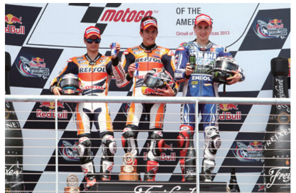
アメリカズグランプリMotoGPクラス表彰台

この新予選方式の導入により、金曜日から始まるフリープラクティスはもちろん、土曜日の公式予選が、より一層スリリングで見応えのあるものとなった。