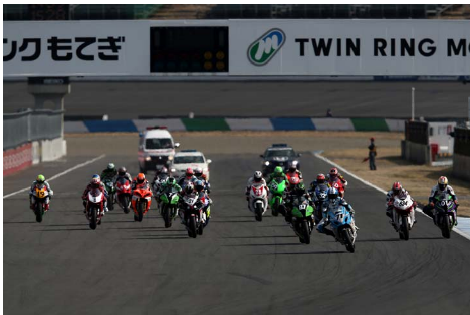
2012年第1戦 JSB1000クラス スタートシーン

さらに、3月30日(土)予選日にオープンする、日本最長343m「メガジップライン つばさ」の誕生を記念した様々なイベント・特典をご用意。全日本ロードレースの2日間を『新生もてぎテイクオフパーティ』と題し、森の中のモビリティテーマパークとしても、新たなスタートを切ります(5ページ目参照)。本リリースではその一部をご紹介します。