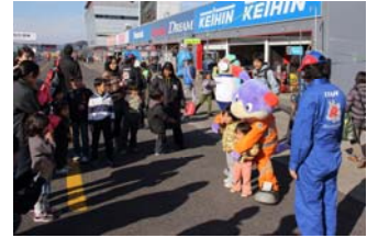
過去のキッズピットウォークの様子

※中学生以下のお子さまを連れた方のみ、ご参加いただけます。 ※同伴される大人の方は、無料でご参加いただけます。 ※大人の方のみの参加はできません。