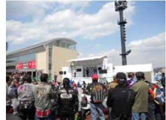
過去のイベントの様子

また、参加者特典として、観戦券をお持ちでない方もピットウォークに参加可能となります。