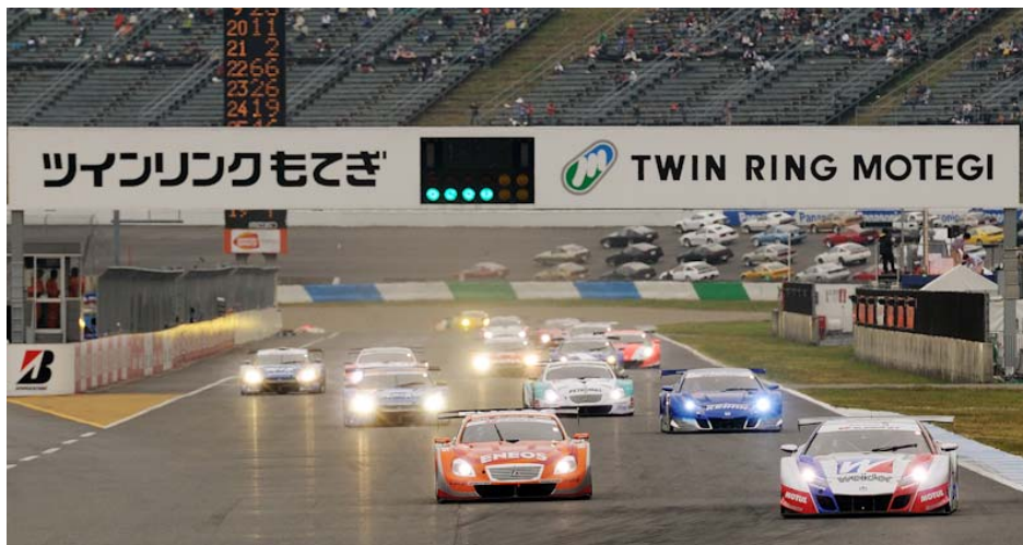
2010年 もてぎ GT 250kmレーススタートシーン

2009年はトップ3が、昨年は上位9チームが栄光の座をかけてもてぎで最終決戦! 今年も、もてぎで新たなドラマが生まれる!