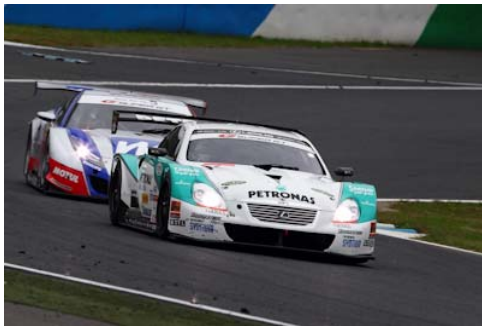
2010年のバトル GT500クラス

だがツインリンクもてぎ最終戦では、それは存在しない。最終戦はウエイトハンディ制が適用されないのだ。開幕戦以来の「ハンディゼロ」だが、開幕戦と大きく違うのがその間にマシンの開発が進んだこと。つまり最終戦ノーハンディウエイトバトルは、それぞれのマシンの真のポテンシャルが明らかになる戦い。GT500、GT300ともにSUPER GT最速マシン、最強マシンがツインリンクもてぎで判明されることになる。