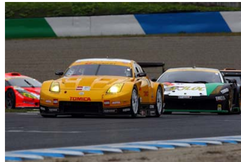
2010年のバトル GT300クラス