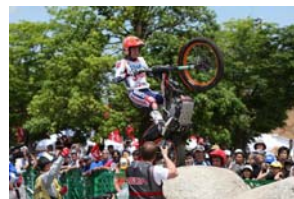
8月20日(土)-21日(日) トライアル世界選手権