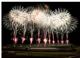
8月14日(日) 花火の祭典

イベント盛りだくさんなこの夏は、 “花火”も“レース”も 夏休みイベントをまとめて楽しめる セット券 がお得！ - 前売セット券は5月28日(土)発売開始！！ -