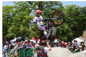
8月20日(土)-21日(日) トライアル世界選手権