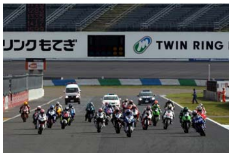
7月2日(土)-3日(日) 全日本ロードレース選手権

東日本大震災で被災したレーシングコース復旧作業を終え、いよいよこの日から、ツインリンクもてぎのレースシーズンがスタートします。また、同日開催の7月2日(土)～3日(日)「全日本ロードレース選手権」と合わせて、様々なお得な特典・イベントをご用意させていただきます。