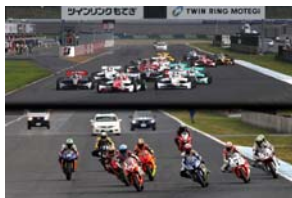
8月6日(土)-7日(日) MOTEGI 2&4 RACE