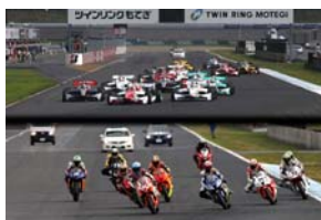
8月6日(土)-7日(日) MOTEGI 2&4 RACE