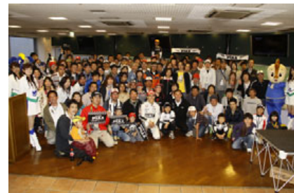
第3戦の祝勝会の様子

※プレゼントのないチームもございます。また、グッズは変更となる場合がございますのであらかじめご了承ください。 ※プレゼントは受付にてお渡しします。