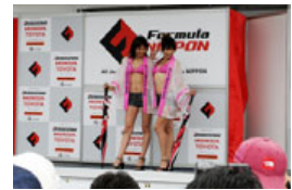
過去のキャンギャルオンステージの様子

■内 容：フォーミュラニッポンドライバートークショー キャンギャルオンステージ など