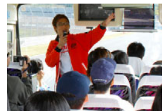
過去のKIDSバスツアーの様子