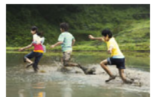
里山わんぱくキッズの様子

★その他にも、各施設にてご家族でお楽しみいただけるイベントをご用意しております。