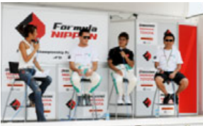
過去のドライバートークショーの様子

グランドスタンド手前のグランドスタンドプラザに設置された特設ステージでは、ドライバートークショー、キャンギャルオンステージなど盛りだくさんのイベントが開催される。