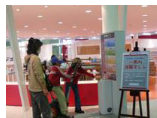
一馬カマシんに挑戦