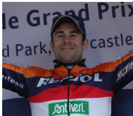
Day2で優勝したトニー・ボウ

ボウと藤波が駆るマシンは2009年モデルとして、外観こそ大きな変更は認められないが、エンジン特性などはまったくの別物に仕上がっており、大会会場に設置された極めて滑りやすい岩盤に手こずった感が否めない。2004年チャンピオンの藤波は、2ラップ目には復調するが、アルベルト・カベスタニーと同点3位。クリーン数の差で藤波が3位の表彰台を獲得した。