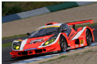
新田守男組ガライヤ