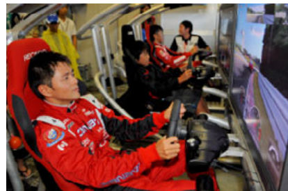
鈴鹿ポッカ1000kmで開催されたグランツーリスモゲーム大会の様子

13日(土)にはゲーム大会も開催。ブースで行われる予選の上位3名は、夕方、キッズピットウォーク中に、ロードコースピットロードに設置されたゲームマシンでGTドライバーと対戦！GTのプロフェッショナルが速いのか！？それともグランツーリスモ使いの「あなた」が速いのか！？グランツーリスモ5プロログによる真剣バトルを見逃すな！