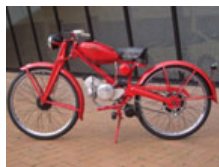
走行が予定されている 1947年製モトグッツィ モトレグラ65