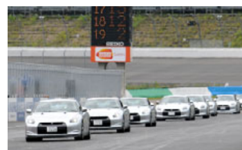
過去のGT-Rパレードの様子