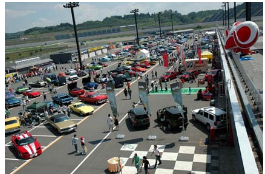
スーパーアメリカンサンデー開催時の会場風景

本イベントは、アメリカンカー愛好家の皆様が、自慢の愛車約150台を所狭しと展示し、ご来場のお客様の投票によってGRAND(大賞)を決定する“CAR SHOW”、アメリカングッズ満載のフリーマーケット“SWAP MEET”、ドラッグレースの迫りを間近でお楽しみいただける“DRAG RACE”の3つを中心としたイベントです。会場全体がアメリカンな雰囲気に染まります。また今年、アメリカンムードを味わっていただける『ツインリンクステーキセット』が初登場。さらにツインリンクステーキセットをご注文いただいた先着30名様には、“アメリカンサンデー(チョコレートサンデー)”をプレゼント。