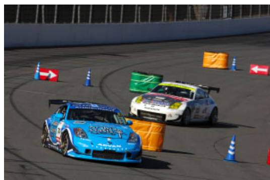
オーバルテストでPanasonicターンを駆け抜けるスーパー耐久マシン

2008年のスーパー耐久シリーズは長い歴史の中に、大きな1ページを刻むことになった。最終戦、第7戦の予選、決勝を11月15日、土曜日に行い、翌16日、日曜日にツインリンクもてぎスーパースピードウェイでのスペシャルレース、「スーパー耐久オーバルバトル」が開催されることになったのだ。スーパー耐久を戦うBMW・Z4Mクーペ、フェアレディZ、ポルシェ911GT3R、ランサーエボリューション、インプレッサ、RX-7、NSX、シビック、インテグラなどが、ハイスピードのオーバルコースを走り、バトルを繰り広げる。想像しただけでもわくわくするレースだ。実際にはスーパースピードウェイの第1、Panasonicターンと第3ターンにシケイン状の減速地帯を設置し、スピードを抑えることになるが、それでも長いストレートではこれまでにないスピードでバトルが行われることになる。すでにこれまで2回のオーバルコーステストが行われており、減速地帯を設置してもSTクラス1のマシンは時速250kmを超えるトップスピードを記録。まさに高速、大迫力のレースが展開されることになる。スーパー耐久ツインリンクもてぎラウンドは、それぞれのクラスチャンピオンをかけたシリーズ最終戦の戦い、それに続く高速オーバルバトルと、見逃すことのできないものとなった。