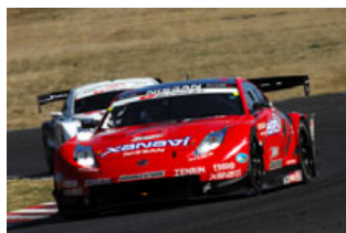
XANAUI NISMO Z

でのGTレースでNSXは実に7勝。2001年から昨年まで6連勝中。この間に予選PPも5回獲得と、まさにライバルを圧倒しているのだ。今年もNSX勢の強さが続けば、タイトルに王手をかけることになる。今シーズンのタイトル争いの行方を、ツインリンクもてぎラウンドが握ることになった。